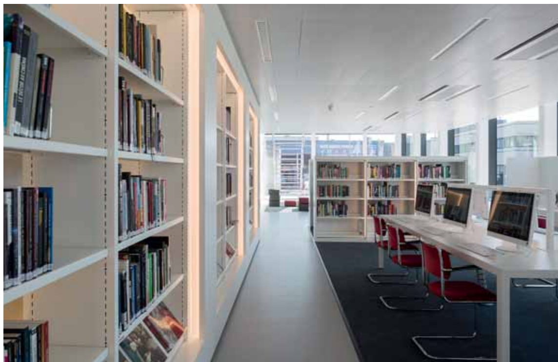
FOTO BOVEN In de EYE Study kunnen studenten en professionals terecht voor research in de collecties.